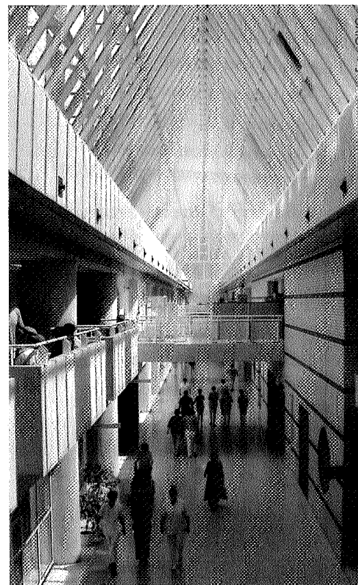
■ In het OLVG wordt momenteel led-verlichting getest.

ter. 'Je ziet vaak dat een zorginstelling de neiging heeft om te lang bij een onderdeel op het gebied van milieuzorg stil te staan. Als bijvoorbeeld energiebezuiniging wordt aangepakt blijven ze daar jaren op terugkomen. Het is efficiënter om je op meerdere criteria tegelijk te richten. Zeker als deze onder verschillende afdelingen vallen.' Hoeveel kosten een efficiëntere milieuzorg ook bespaart, meestal worden aanbestedingen